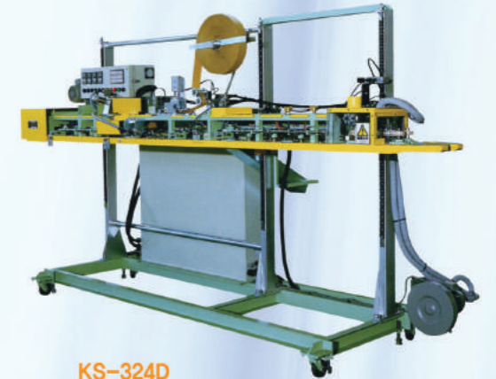
KS-324D ▶ PE 내장 지대백을 미싱을 사용하지 않고 내부 PE 실링후 백상단을 한번 겹쳐서 NOS-TAPE으로 접착함으로 100% 방수방습 포장이 가능