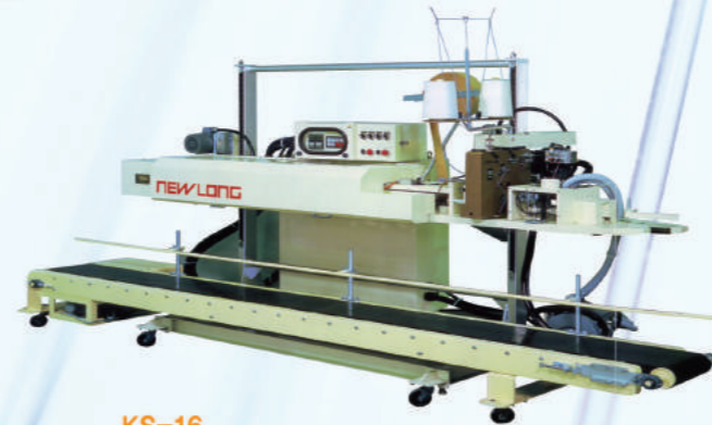
KS-16 ▶ 미싱으로 포장한 후 NOS-TAPE로 실링하여 주는 기계