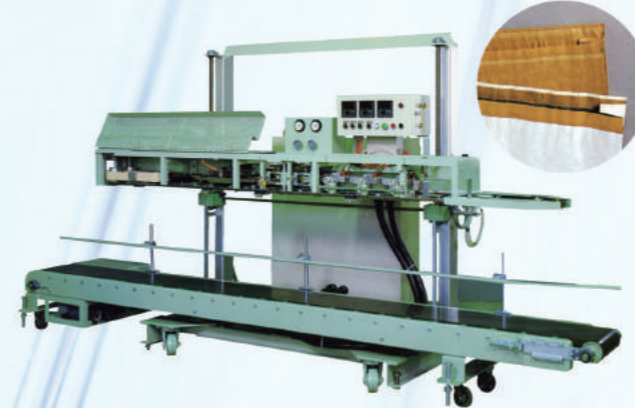
PBC-3W (Pinch Bag Sealing) 1. 백상입에서 실링봉함까지 완전 자동. 2. 내용물, 백사양에 따라서 7가지의 표준모델이 준비되어있음. 3. 뜨거운 공기로 핫멜트를 녹인 후 프레스롤로 완전히 백을 압착시킨다. 더블핀치의 경우 내용물을 먼저나 숨기로부터 보호하기위해 내부 PE를 실링하여 줍니다.