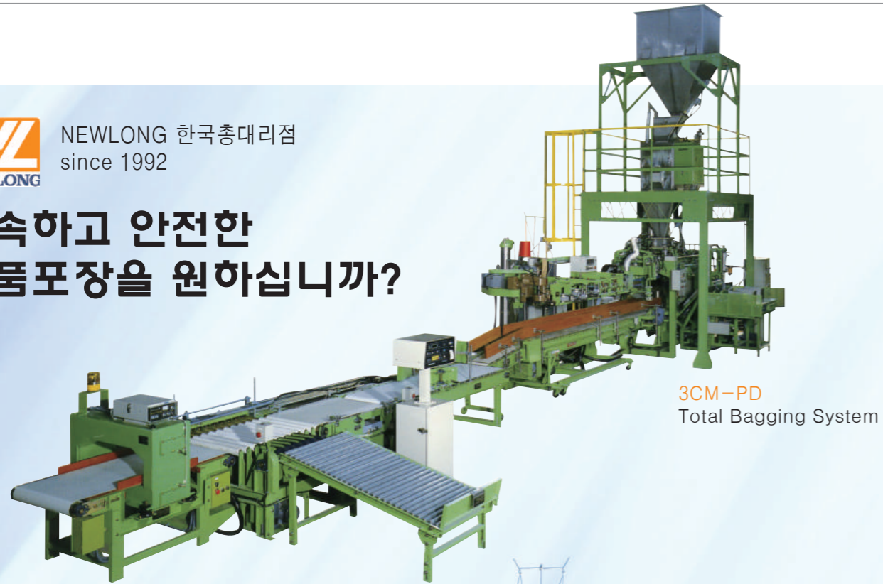
3CM-PD Total Bagging System