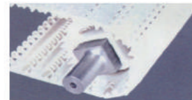
스프로킷 구동으로 벨트 쓸림이 없음.