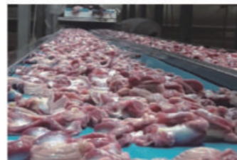
전화 주시면 이에 맞는 자료를 찾아 보내드립니다.

Intralox( www.intralox.com ) 플라스틱 벨트는 품질 보증을 위한 고순도 원료 관리를 통해 미국 본사에서만 생산됩니다. 인장강도(안전계수 포함), 내마모성, 내화학성에서 타사 복사본 대비 확연한 차이가 있으며 사용 후 진가를 알 수 있습니다. 더욱이 FDA, USDA 승인품인 Intralox의 Data Sheet(기술자료)보다 더 좋은 자료를 만들어 (Test 불가 인식) 비신사적 영업을 하고 있으니 주의하시기 바랍니다. 그리고 미국 및 네덜란드 Rexnord( www.rexnord.com ) 제품을 이용한 음료 및 맥주공장 자동화에도 기여하고 있으며, 저희 회사는 1986년 이후 일본의 각 산업(특히 식·음료) 분야에 각종 컨베이어류 수출을 가장 많이 해오고 있습니다. 공항, 우체국, 배터리, 타이어, 식품, 음료, 닭고기, 각종 육류, 제과, 제빵, 어류 및 골판지 등의 생산 라인의 생산성 효율을 높이시려면 35년 동안 한 우물만 판 대광하이텍( www.dkconv.co.kr ) 과 상담하십시오. 기다리겠습니다!