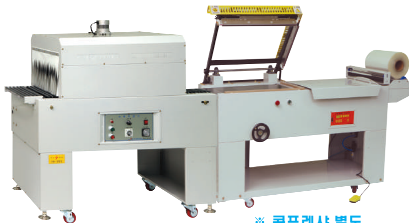
※ 콤프레샤 별도