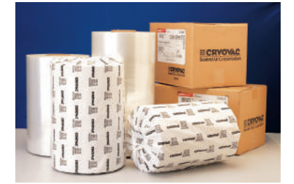
크레오박 필름 : Cross Linked